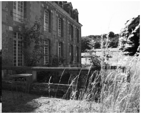
La façade nord sur les champs