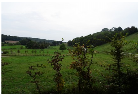
La vallée de la Lieure

Pour le reste du périmètre de 500m et le site inscrit Les avis seront cohérents avec ceux émis ces dernières années, à savoir : pas de maisons à volume compliqué (type V, W, Y, ou Z), pentes à 45° pour les volumes principaux, ardoise ou tuile plate de teinte brun vieilli, à 20u/m², avec un débord de toiture de 20cm, enduit de teinte beige clair avec modénatures (au choix : chaînages, encadrement de fenêtres, soubassement, colombage...). *Voir les autres fiches.