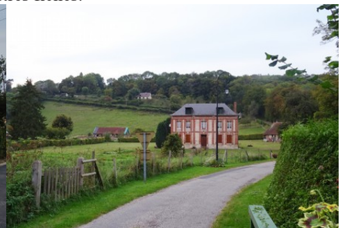
Le cadre rural