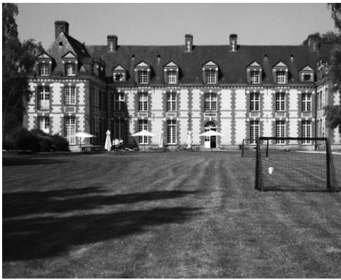
La façade sud (vue éloignée)