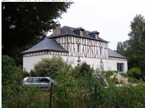
Quelques maisons dans les abords