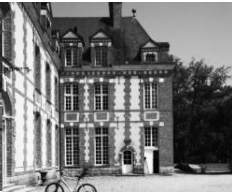
L'aile est depuis la cour